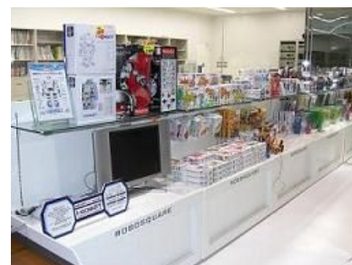
ロボットセンター ロボスクエア店

また、全方位センサなど研究開発分野向け製品もデモ機を設置し、首都圏で購入を検討される方々の便を図ります。