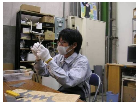
アルミパーツのバリ取りを体験