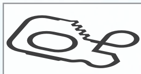
付属のライトレースコース

ブロックと矢印をつなげてロボットを動かすプログラムを作成します。ライトレースの課題にチャレンジすることでセンサを用いた計測やプログラムによる制御の学習ができます。