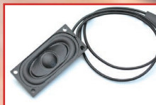
音声出力標準搭載