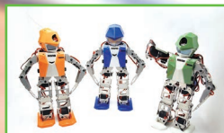
オリジナル外装オプション