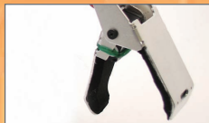
ハンドユニットで 多彩な動作が可能