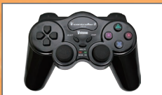
ロボット専用無線コントローラー 「VS-C3」